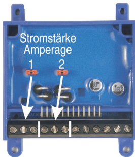
Abbildung 2: Einstellung der Stromstärke Illustration #2: Adjusting the trigger amperage